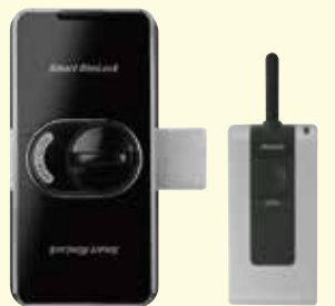
■室内ボディ部 ■室内リモコン ※室内リモコンはSmart RimLock Rに標準装備 ※スマートリムロックリモコンモデル以外はリモコンをご使用出来ません。

現在の鍵はそのまま、防犯性の高い電気錠を追加!! 安心・安全・高セキュリティ を全てのドアに!!